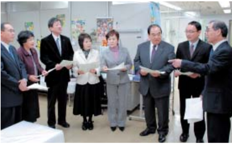
救急医療センターを視察する公明党市議団

また、市長マニフェストには「センターの診療は夜の0時で終了してしまうため、それ以降に病気になる朝の診療が始まるまでの間、苦しむこととなります。」とありますが、改めて説明するまでもなく、センターが閉まった後は各診療科の輪番病院があり、小児科においては、うわまち病院と市民病院が24時間体制で診療にあたり、決して市民が苦しんで待つことはありません。