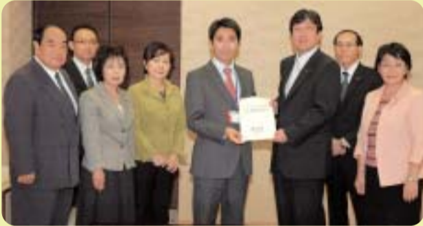
市長に予算要望書を提出する市議団

公明党横須賀市議団は去る10月5日、平成22年度の予算要望書を吉田市長に提出しました。厳しい財政状況を踏まえ、限られた財源を選択と集中によって効率的に予算配分することを求めるとともに、現下の厳しい経済状況のもと、市民生活に配慮した施策の推進を訴えました。具体的には、①行財政改革の更なる推進 ②福祉・医療・介護サービスの充実 ③子育て・教育環境の充実 ④環境対策について ⑤安全・安心のまちづくり ⑥地域コミュニティの活性化 ⑦地域経済の活性化を重点項目に掲げ、その実現を求めました。詳細は、公明党横須賀市議団のホームページをご覧ください。【 http://www.yokosuka-komei.jp 】